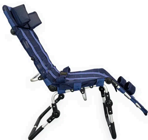
синий / чёрный