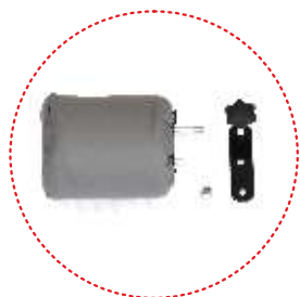
клин с регулировкой