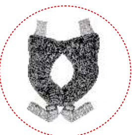
ремни для удержания и стабилизации