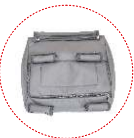
корзина для покупок