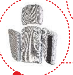
сужающие и расширяющие вставки