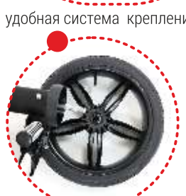
удобная система крепления колес