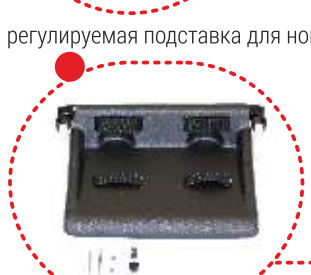
регулируемая подставка для ног