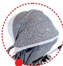
регулируемый капюшон с окном